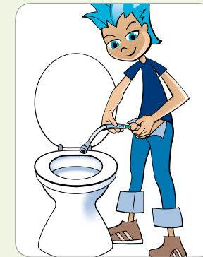
Stehend vor der Toilette