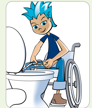
Im Rollstuhl zur Toilette